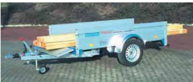
QL 1351 beladen: Vordere und hintere Bordwand abgeklappt.

QL 751 mit Zubehör: Stützrad leicht, Rohrstützen hinten 2 Stück mit Klemhalterung, Staubox seitlich und Lastenträger mit Fahrradträger. Der Lastenträger ist über die Ladungssicherung TOPZURR® 24 befestigt und kann so kinderleicht auf- und abmontiert werden, ohne den Anhängerboden zu beschädigen. Zum Fahrradtransport ist der Fahrradträger auf den Lastenträger aufgesetzt. Maximal 5 Fahrräder finden darauf Platz.