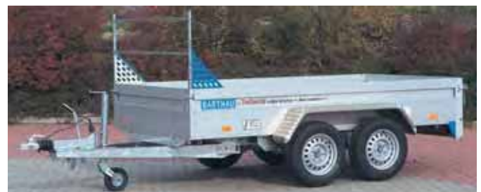
QL 2702 mit Zubehör: H-Galerie 600mm hoch gesichert mit Lochblechen gegen unbeabsichtigtes Herausziehen oder Kippen. Das obere Rohr ist drehbar gelagert und paßt sich der Ladung an. Aluminium-Riffelblechkotflügeln statt Blechkotflügeln.