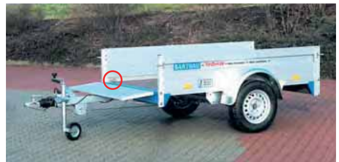
QL 1001: Vordere und hintere Bordwand abklappbar.