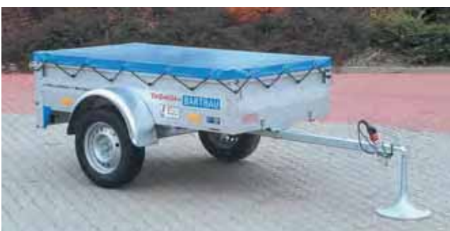
QL 751 mit Zubehör: Flachplane, serienmäßig in hellgrau, andere Farben gegen Mehrpreis lieferbar.